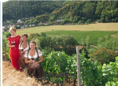
Weinmajestäten im Weinberg