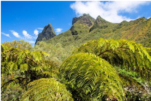
Cirque de Cilaos

Tageswanderung von ca. 3 Stunden. Fahrt zu einem schönen Aussichtspunkt, wo man den Talkessel gut überblicken kann. In der Nacht erleben wir einen strahlenden Sternenhimmel, wie man ihn selten sieht -sofern es wolkenfrei ist - Unterkunft Cilaos