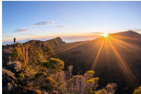
Vulkan Piton de la Fournaise