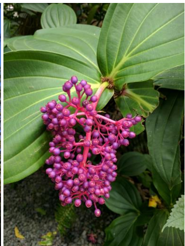
Garten der Düfte und Gewürze

Hinweis: bei allen Fotos dieses Programms handelt es sich um eigene Aufnahmen