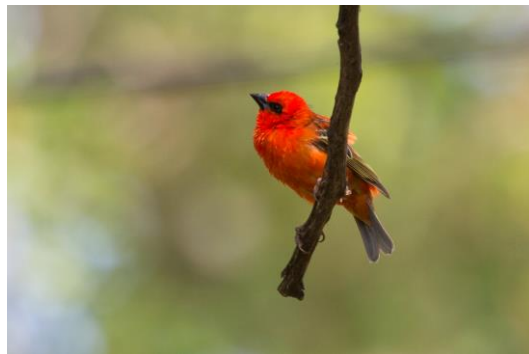
Cardinal-Vogel im Garten

In kurvenreicher Fahrt geht es wieder hinunter Richtung Südküste und wieder hinauf in ein anderes Tal, das Richtung Vulkanlandschaft führt. Im Vulkan-Museum erfährt man alles Wissenswerte über Vulkanismus und hat Spaß im 3D-Vulkan-kino. Übernachtung in Bergunterkunft.