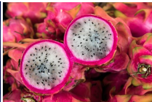
Pitayas am Marktstand