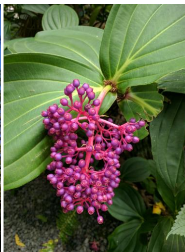
Garten der Düfte und Gewürze