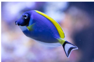
Doktorfisch im Aquarium

Ein erholsamer Tag im badefreundlichen Westen der Insel. Im Aquarium bekommt man einen Einblick in die Unterwasserwelt, die uns eine bezaubernde Vielfalt an Meeresbewohnern präsentiert. Als Botanikfreunde besuchen wir den bezaubernden „Jardin Eden“. Mit etwas Glück sehen wir dort nicht nur exotische Pflanzen, sondern auch giftgrüne Chamäleons und den roten Cardinalvogel. Hotel St. Pierre