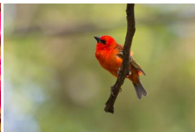
Cardinal-Vogel im Garten

Wir besuchen am Vormittag das Kokos-Museum und die Schutzstation für Meeresschildkröten. Am Nachmittag kann man die Freizeit für einen Einkaufsbummel im Marché Couvert nutzen. Hotel St. Pierre