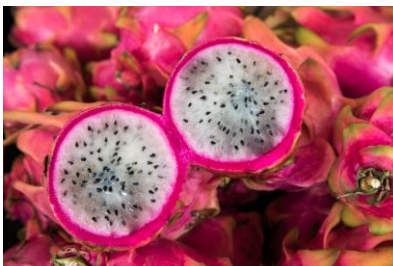
Pitayas am Marktstand