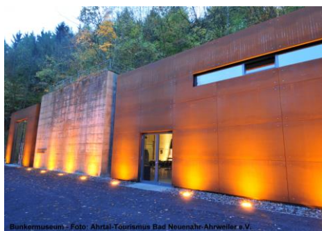
Bunker Museum