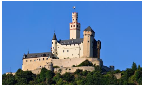
Marksburg in Braubach